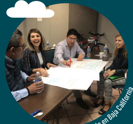
Taller del proyecto en Baja California

Muchas veces los gobiernos son celosos. Por ejemplo, si yo soy energía, pues yo me dedico a lo mío, que es energía y no me meto con la que sigue que es cambio climático. Pero, en este caso, el cambio climático y la energía eléctrica van de la mano. Entonces, buscar esas alianzas, con el sector público, el sector privado, academia, ONG, etc. No desanimarse, trabajar mucho en equipo, y dejar los egos a un lado para poder hacer algo bueno por este planeta.