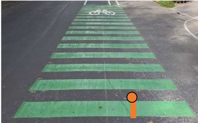
CRUCE CICLISTA Cruces de calle y salidas vehiculares