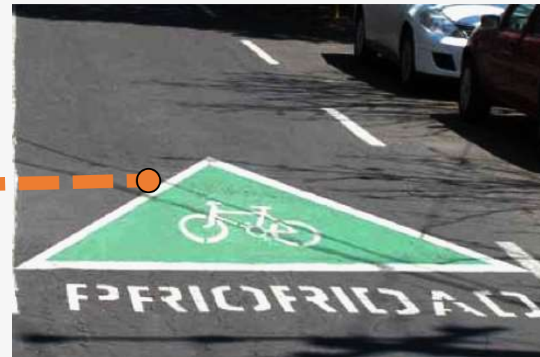
CICLOVÍA CON ESTACIONAMIENTO DE LADO IZQUIERDO