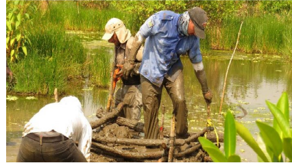
Restauración de manglar.