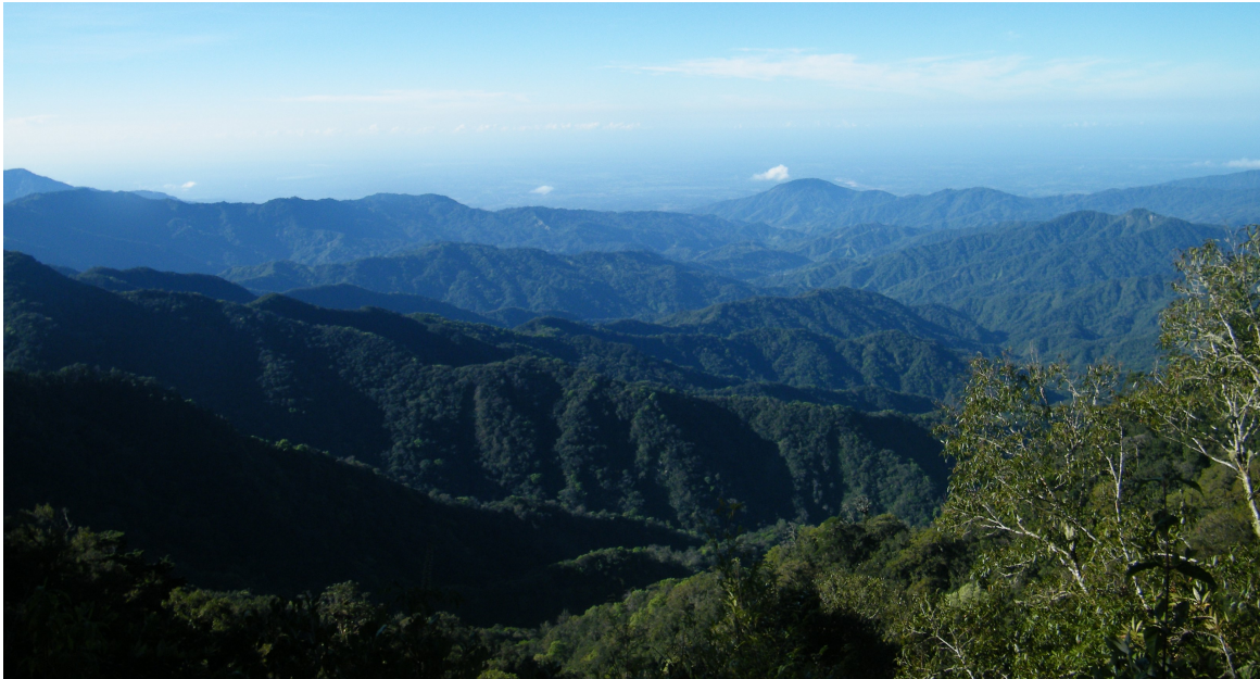
Reserva de la Biosfera "El Triunfo" en Chiapas

El proyecto “Gobernanza Multinivel y gestión del carbono a escala paisaje” ofrece acceso a estudios, artículos y videos sobre Monitoreo, Reporte y Verificación (MRV) y gobernanza multinivel para reducir las emisiones de gases de efecto invernadero provenientes de la deforestación y la degradación de los bosques (REDD+) en México. Seguir leyendo