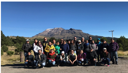
Participantes de la Escuela AbE durante la visita de campo al Izta-Popo

La adaptación es un elemento clave de la política climática mexicana, que se refleja en las 21 acciones de adaptación definidas en la CND del país. Además, México anunció el desarrollo de un Plan Nacional de Adaptación (NAP) en la COP23. El país considera la Adaptación basada en Ecosistemas (AbE) como un enfoque clave para la implementación exitosa de la NDC. Varios proyectos de IKI apoyan los esfuerzos de México para adaptarse a los