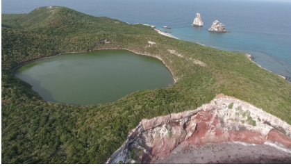
Parque Nacional Isla Isabel en el Golfo de California

El Programa BioMar concluye exitosamente un plan de trabajo que asegura una línea base de Fichas de Evaluación Ecológica (Scorecards) para todas las Áreas Naturales Protegidas del Golfo de California. La elaboración de los scorecards e informes contribuye a los objetivos nacionales para el cumplimiento de la Meta 11 de Aichi de la Convención sobre la Diversidad Biológica así como del ODS 14: Vida Submarina de la Agenda 2030. Sigue leyendo