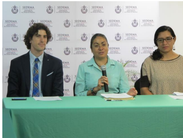
Inauguración del Taller.

La discusión del Sistema se llevó a cabo en dos mesas: 1) Sistema Social, Capacidades Gubernamentales y Capacidades Sociales; y 2) Información Climática y Gestión del Riesgo, Sistema Productivo y Servicios Ecosistémicos.