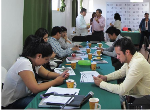
Mesa de trabajo 1.