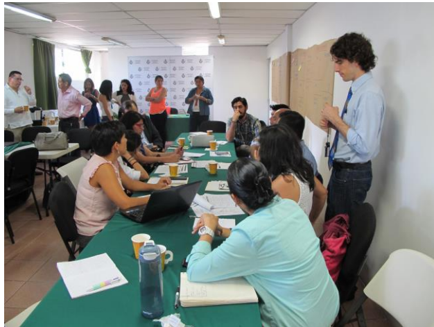
Mesa de trabajo 2.

La selección de grupos se basó en el área de trabajo de los participantes, resultando en contribuciones tales como: