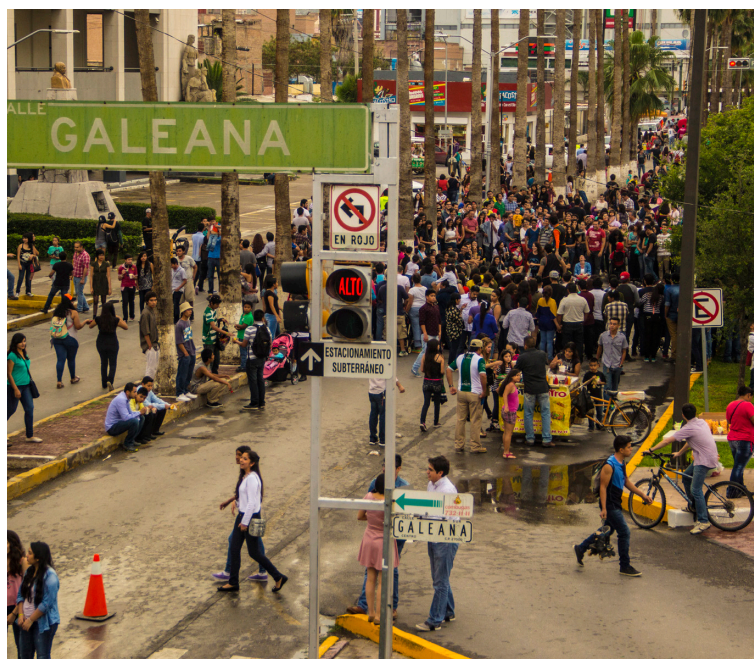
Cierre de calle por el Moreleando.