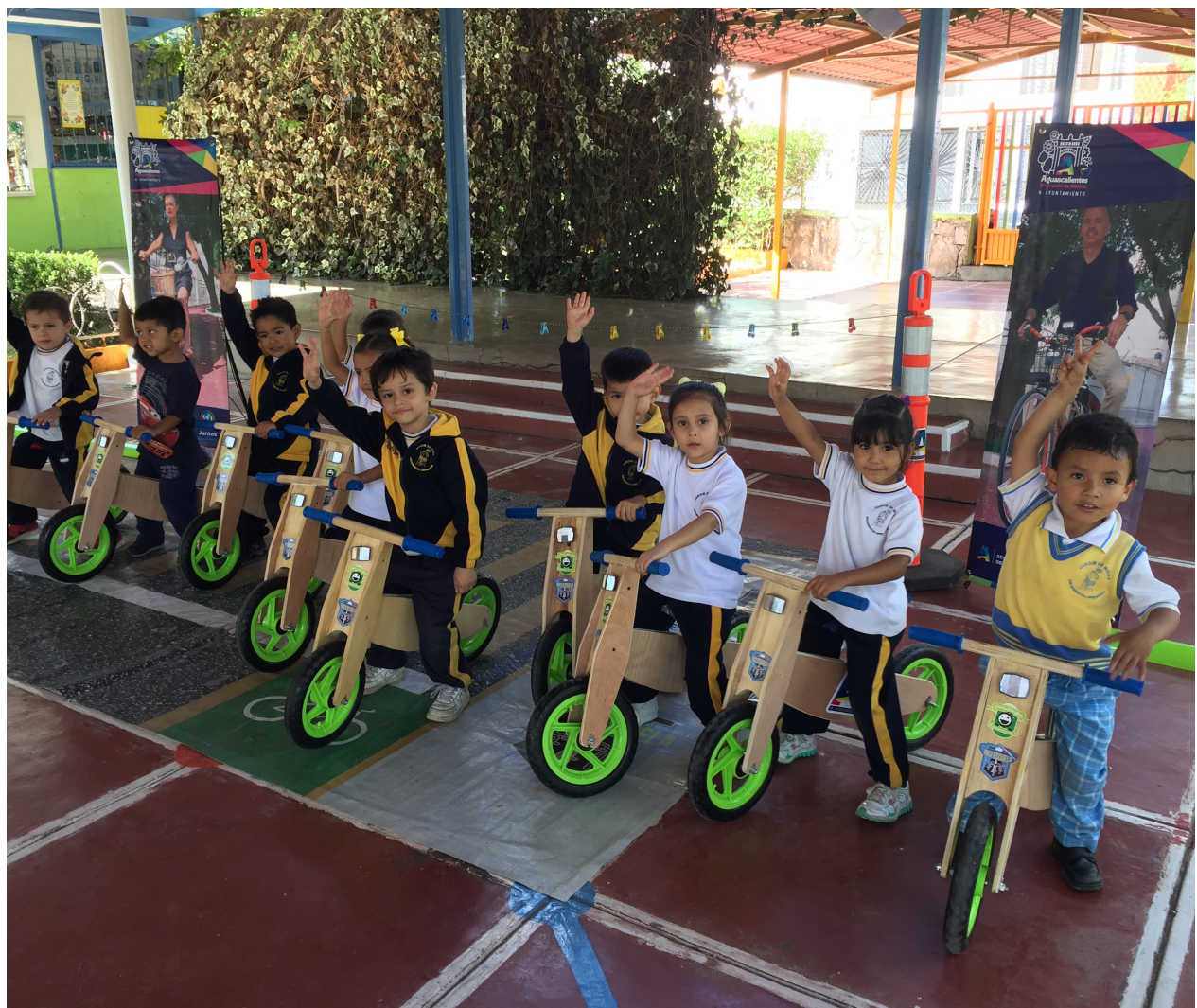
Bici Escuela para las niñas y los niños.