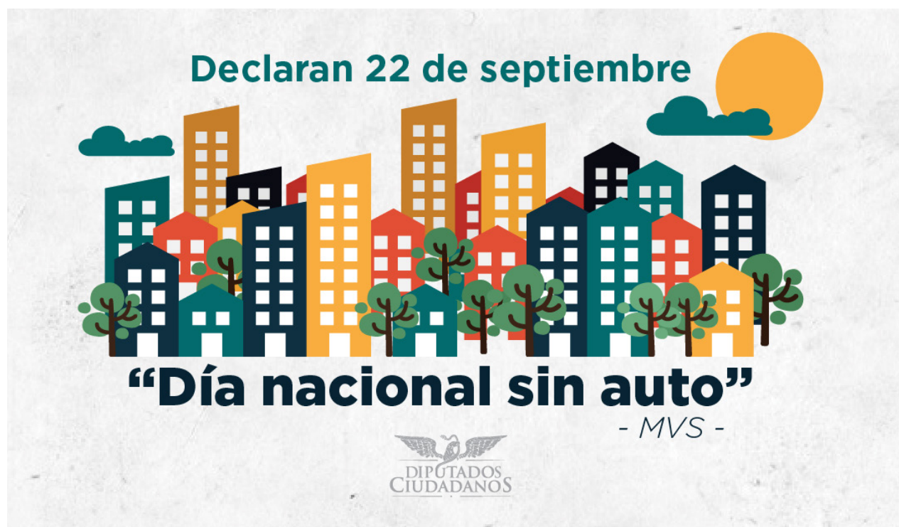
Anuncio de la declaración del 22 de septiembre como Día Nacional sin Automóvil.