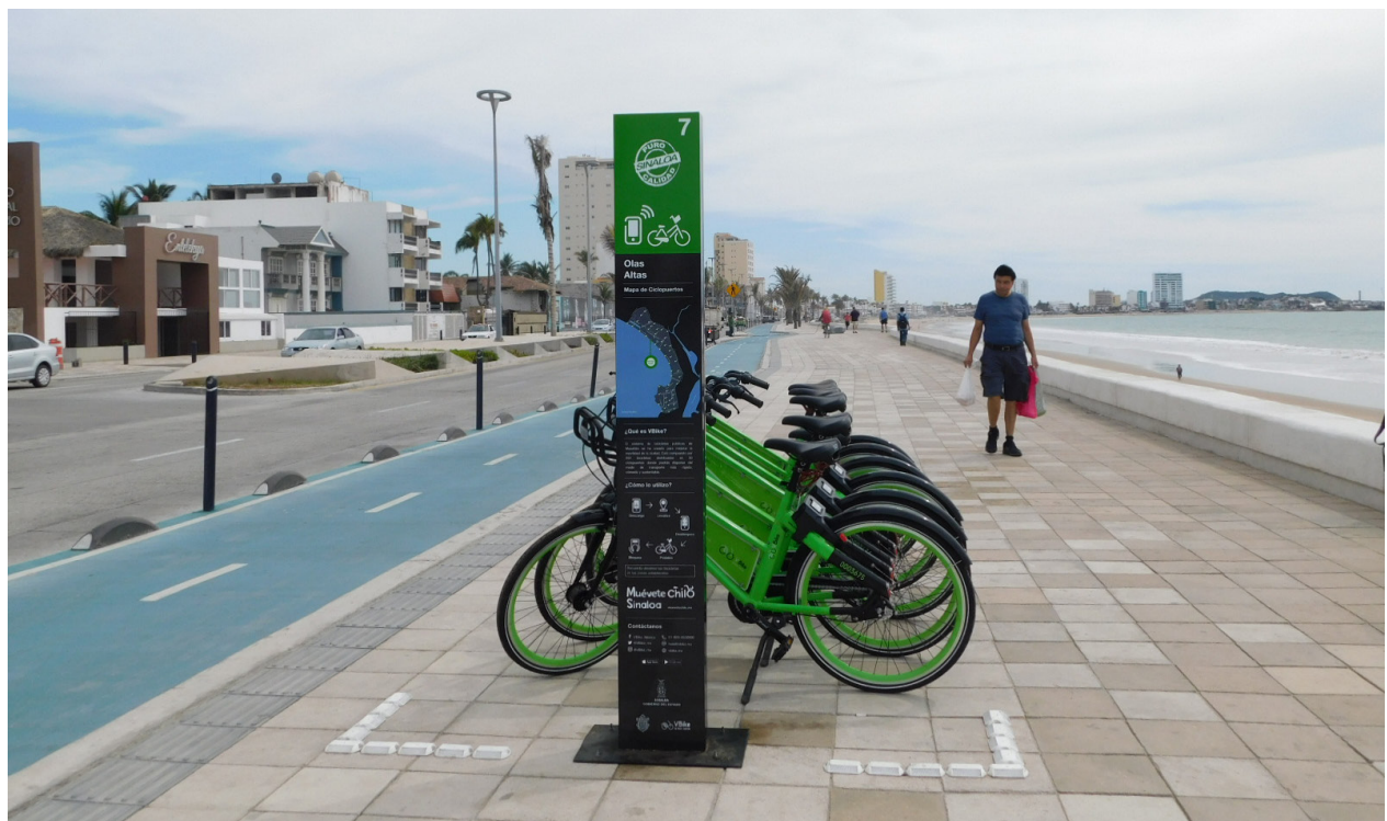
Estación 7 en el malecón de Mazatlán.

Estatal y el sector privado Origen de los recursos