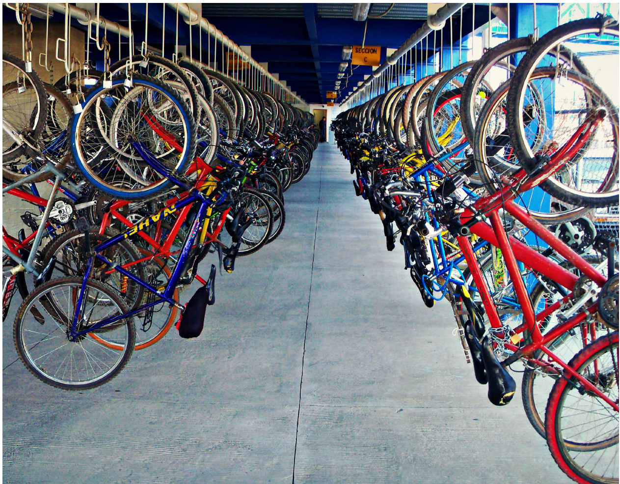
Biciestacionamiento Masivo en la estación Cuautitlán Izcalli del Tren Suburbano.