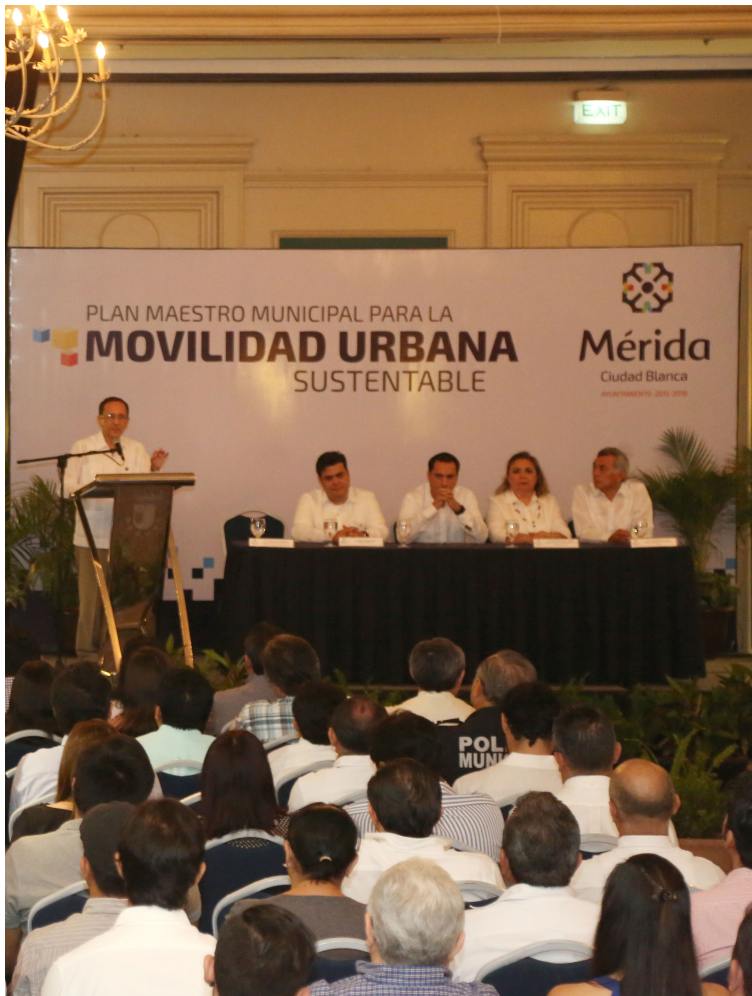
Presentación del Plan Maestro.