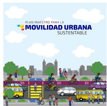
Plan Maestro para la Movilidad Urbana Sustentable.