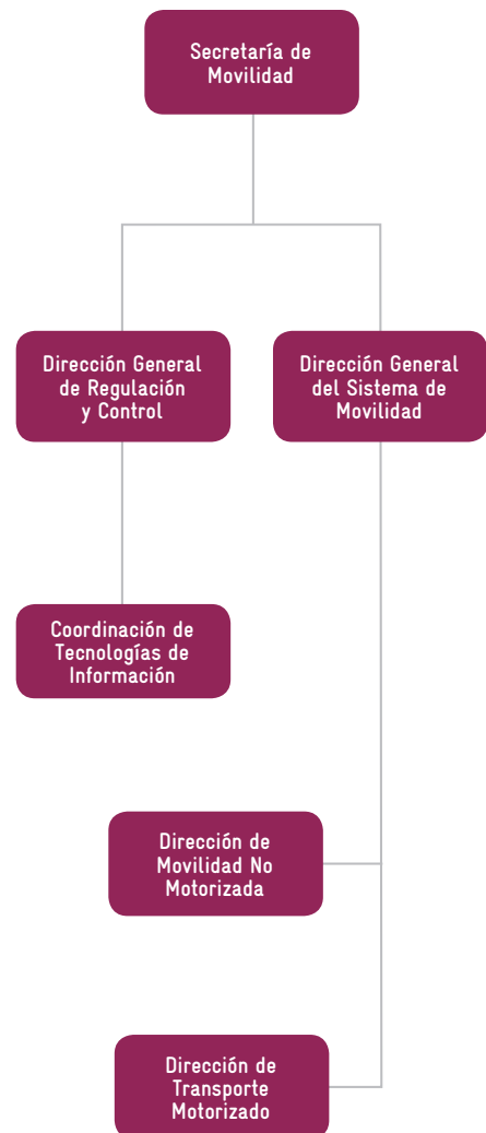
Estructura orgánica de la Secretaría de Movilidad de Colima.