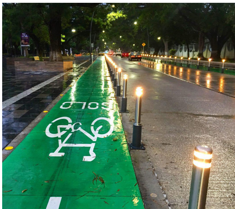
Ciclovía Galván.

Sus funciones y atribuciones están reconocidas en la Ley Orgánica de la Administración Pública del Estado de Colima 1 y el Reglamento Interior de la Secretaría de Movilidad 2 , respectivamente. Durante sus dos años de gestión, la SEMOV ha generado instrumentos y proyectos importantes para la movilidad en coordinación con grupos de la sociedad civil que buscan mejorar la movilidad peatonal y ciclista.