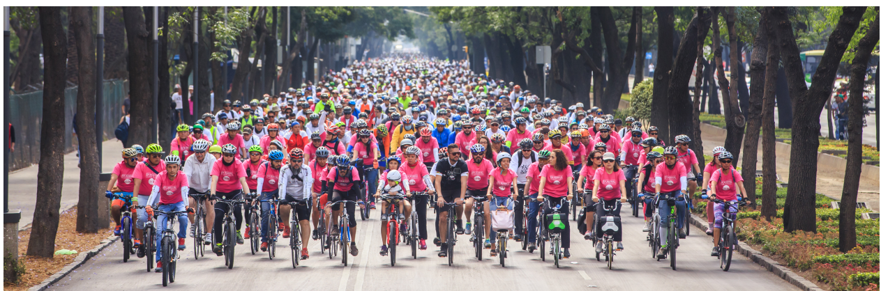
Gran Rodada Ciclista. Fotografía: Enrique Abe, SEDEMA - Ciudad de México.

Estructura orgánica de la Dirección de Cultura, Diseño e Infraestructura Ciclista. Tomado de SEDEMA - Ciudad de México.