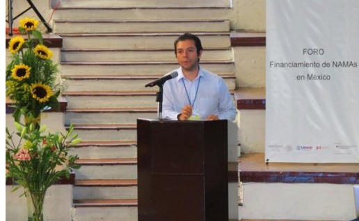
Imagen 2. Presentadores NAMA sector privado