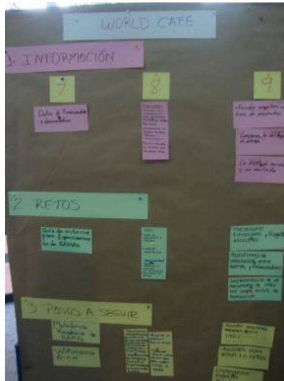
Imagen 5. Resultados mesas 7-9

La transcripción de las mamparas de resultados se muestra a continuación: