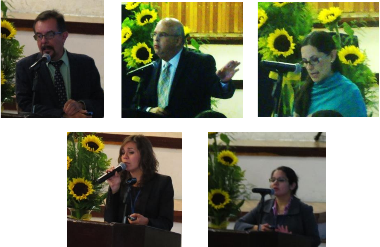
Imagen 1. Presentadores NAMA sector público