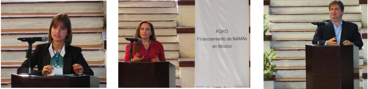
Imagen 3. Presentadores Financiamiento