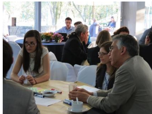
Imagen7. World Café